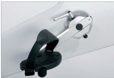
オプション: 長さ調節付きクランクレバー